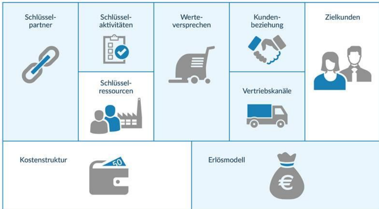
Abbildung 1: Eigene Darstellung Business Model Canvas nach Osterwalder et al. (2010)

Durch die Vernetzung der Reinigungsmaschinen mit IoT Technologien ergibt sich die Möglichkeit für den Produzenten, Reinigung als Dienstleistung anzubieten. Die blau eingefärbten Bereiche in Abbildung 1 sind jene Geschäftsmodellkomponenten, die sich durch die Digitalisierung des Produktes und seiner Services verändert haben.